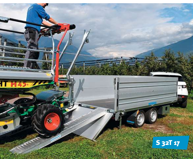
S 32T 17