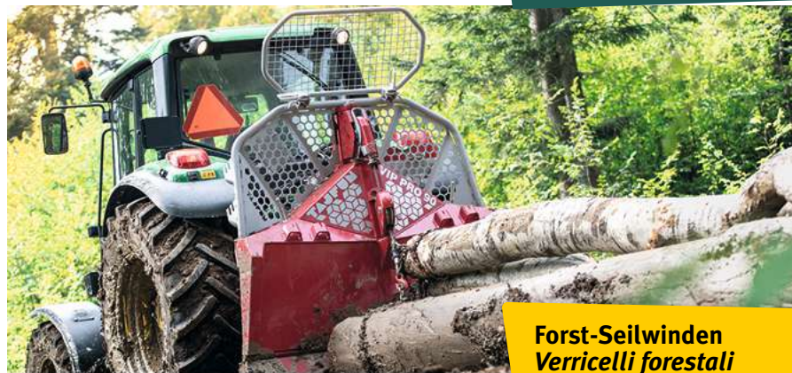
Forst-Seilwinden Verricelli forestali