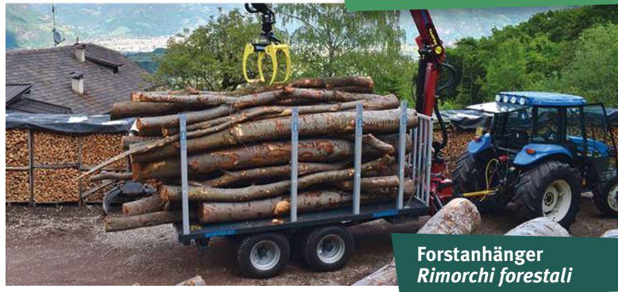
Forstanhänger Rimorchi forestali