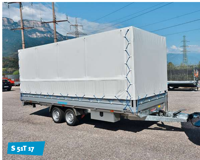
S 51T 17