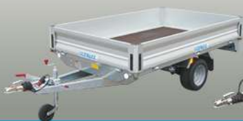
Einachsanhänger Rimorchi monoasse