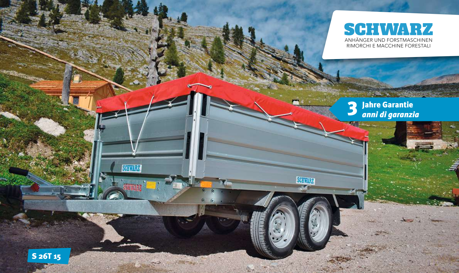
S 26T 15