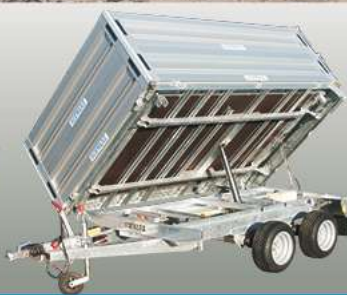
Kippanhänger Rimorchi ribaltabili