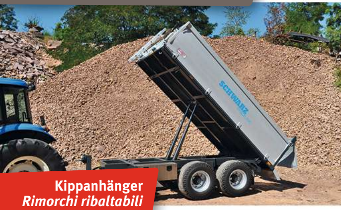
Kippanhänger Rimorchi ribaltabili