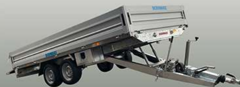
Rückneiger Rimorchi inclinabili