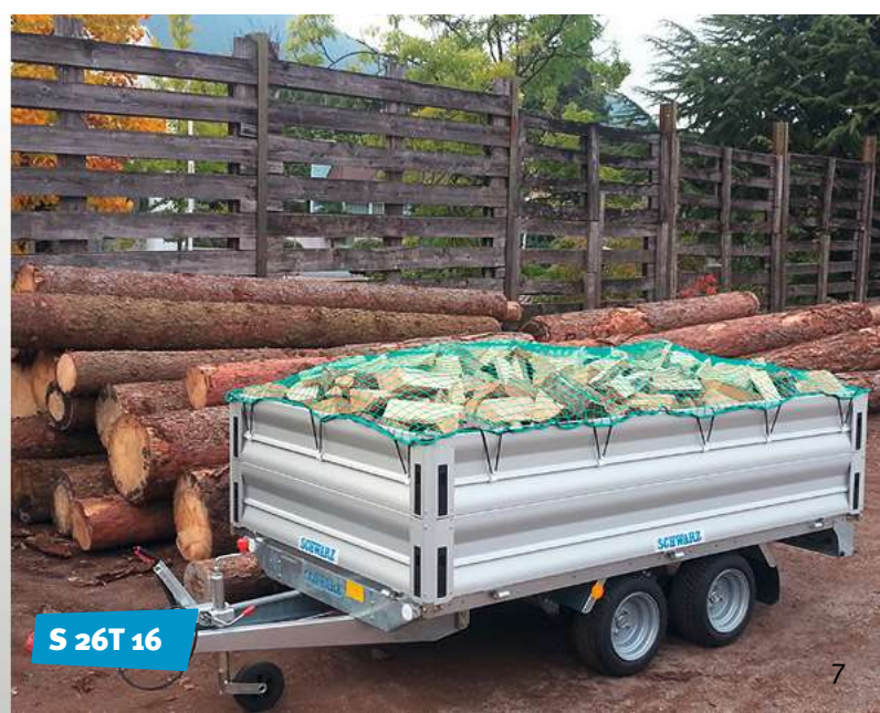
S 26T 16