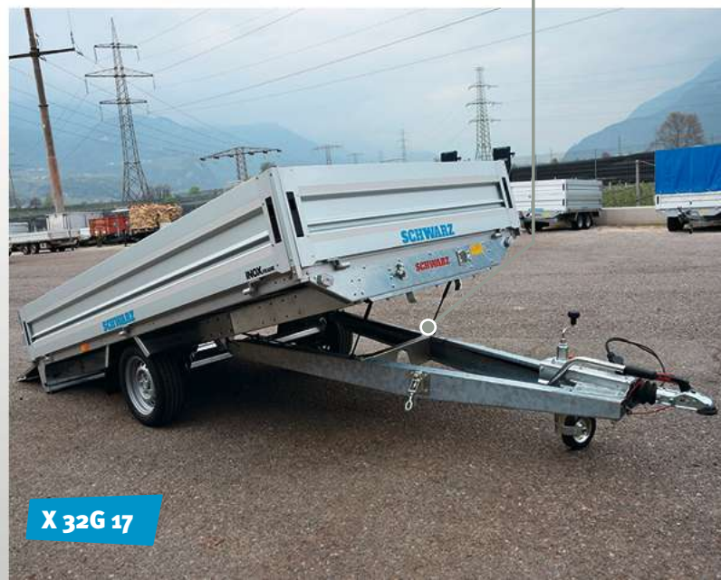
X 32G 17