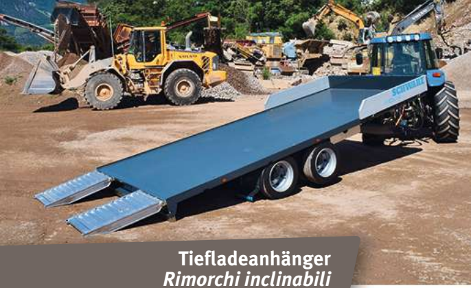
Tiefladeanhänger Rimorchi inclinabili