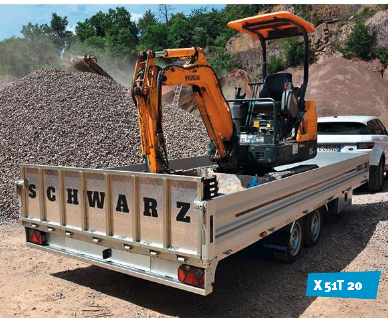
X 51T 20