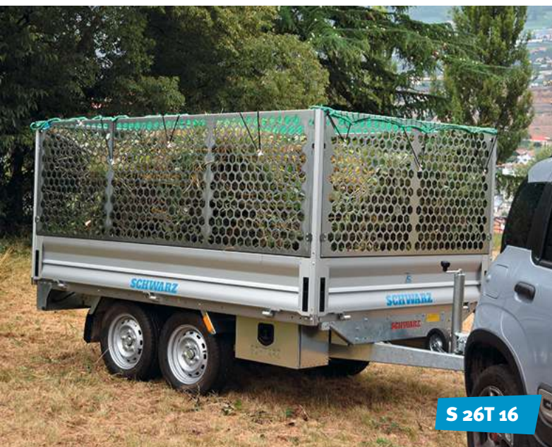
S 26T 16