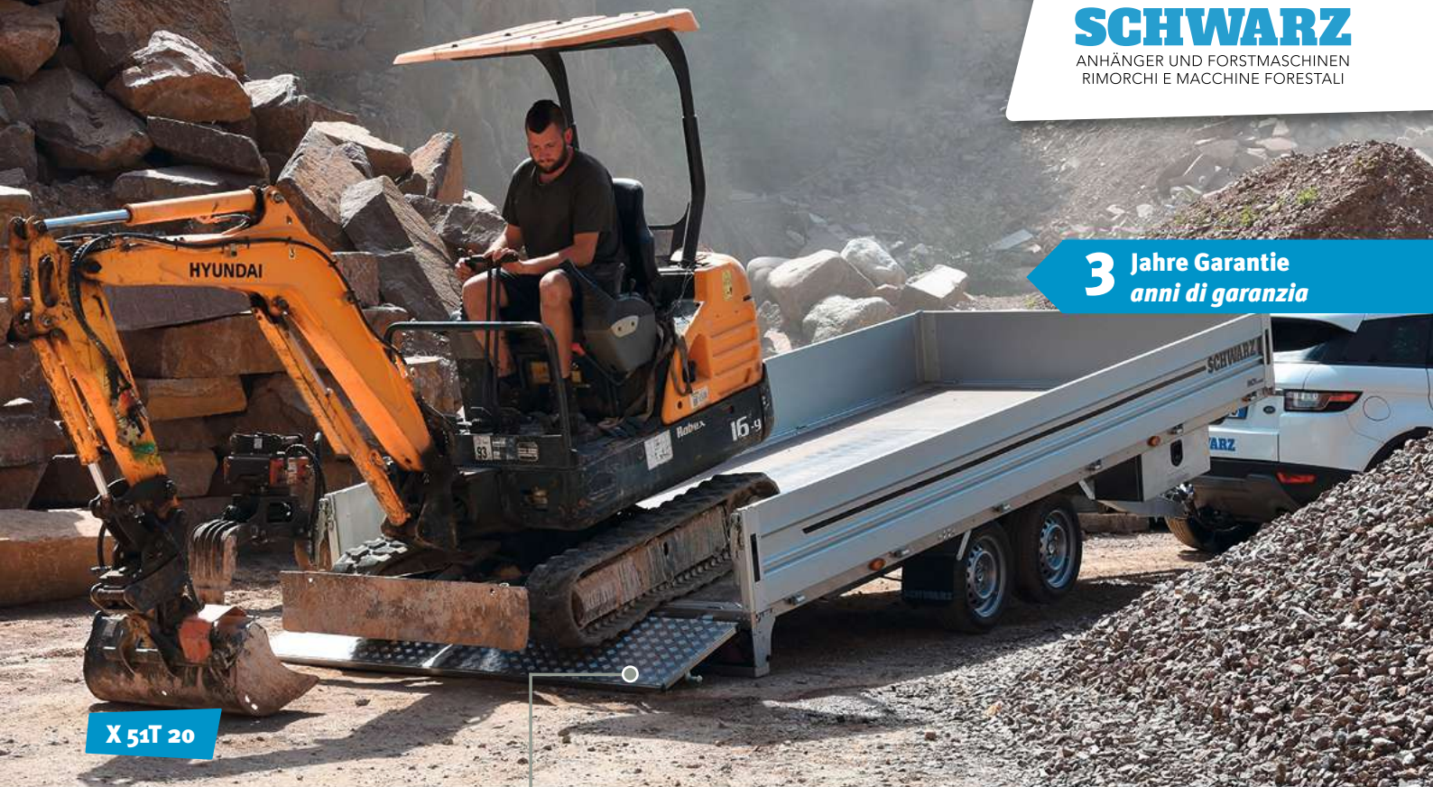
X 51T 20