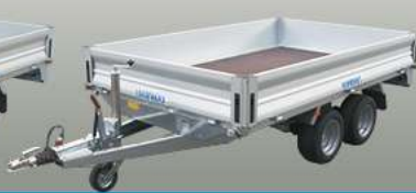
Tandemanhänger Rimorchi doppioasse tandem