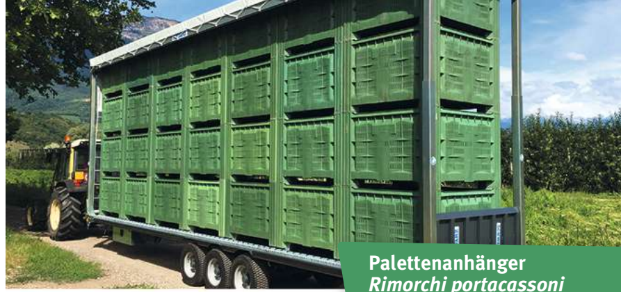
Palettenanhänger Rimorchi portacassoni